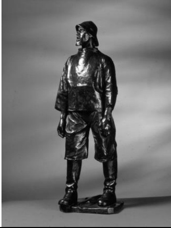
Constant Meunier, Oostendse Visser , 1890