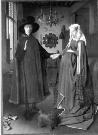
Jan Van Eyck, Arnolfini dubbelportret , 1434