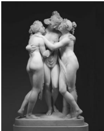
Antonio Canova, De drie gratiën , 1813-1816