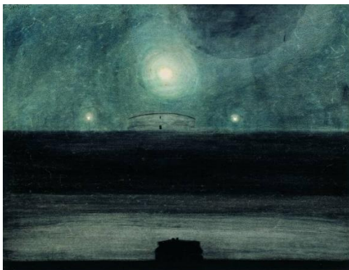
Léon Spilliaert - Strand met maan – Collectie Mu.ZEE

De bezielde landschappen en marines van Léon Spilliaert tonen eerder een nabeeld dan het beeld zelf. Mijn schilderij is 's nachts gemaakt omdat ik net als Spilliaert last heb van slapeloosheid. Ik heb geprobeerd om het onwezenlijke licht dat je ook in veel van zijn werken ziet, weer te geven. Mijn werken dragen geen titel maar in plaats daarvan een catalogusnummer van een systeem dat ik zelf ontwikkeld heb. Op die manier wordt geen enkele interpretatie opgedrongen aan de toeschouwer.