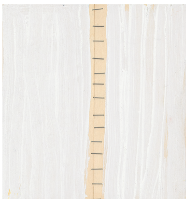
Raoul De Keyser, LI-AI-SON, 2012

Twaalf nietjes heeft Raoul De Keyser hier gebruikt om twee houten plankjes te verbinden. Dit kunstwerk noemde hij 'LI-AI-SON'. Het woord bestaat uit drie lettergrepen met liggende streepjes aan elkaar verbonden. Het lijken wel nietjes. 'Liaison' is Frans voor verbinding. Op de koop toe verwijst de titel naar een persoon waar de kunstenaar een goede verbinding mee had!