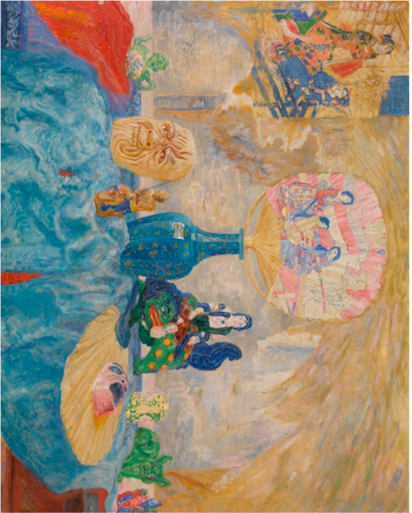
James Ensor, Stilleven met chinoiserieën , 1906, KMSKA