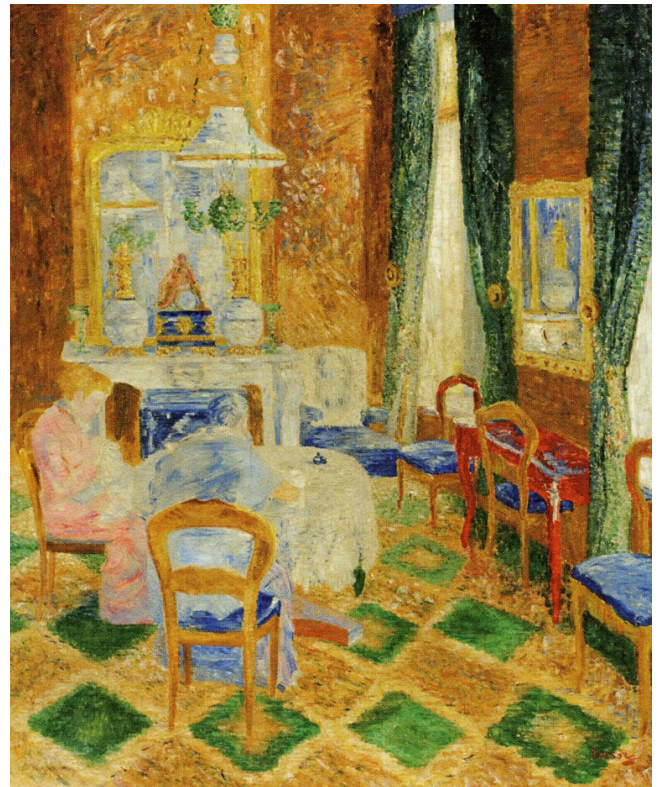
James Ensor, Burgersalon, 1911, Clemens-Sels-Museum, Neuss

Ensor was bekend voor zijn kritiek op het burgerlijke milieu. In 'Burgersalon', een werk uit 1881 is dit nog niet van toepassing. Wel integendeel. De nadruk ligt hier op de slaperige sfeer in het huis waar Ensor woonde. Het lijkt bijna een stilleven met versteende figuren. Het werk hoort duidelijk thuis binnen de stijl van het Realisme. Zijn figuren worden afgebeeld in hun vertrouwelijke omgeving. Ze zijn bezig met hun dagelijkse taken. Maar Ensor voegt er wel een impressionistische touch aan toe.