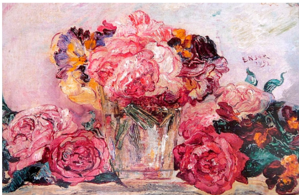
Campagnebeeld 'Rose, Rose, Rose à mes yeux, James Ensor en het stilleven in België 1830-1930' in MuZEE Oostende

Aangezien deze activiteit niet in lesverband gebeurt, kun je als leerkracht alleen maar een begeleidende coach op afstand zijn. Wat op zich niet fout is. Je kunt deze kunstzinnige activiteit ook zien als 'wij jongeren deden dit helemaal op ons eentje!'. En dat werkt uitstekend bij jongeren.