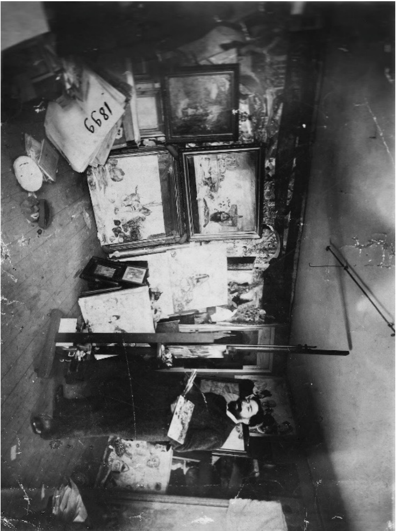
Anoniem, James Ensor in zijn atelier, 1900