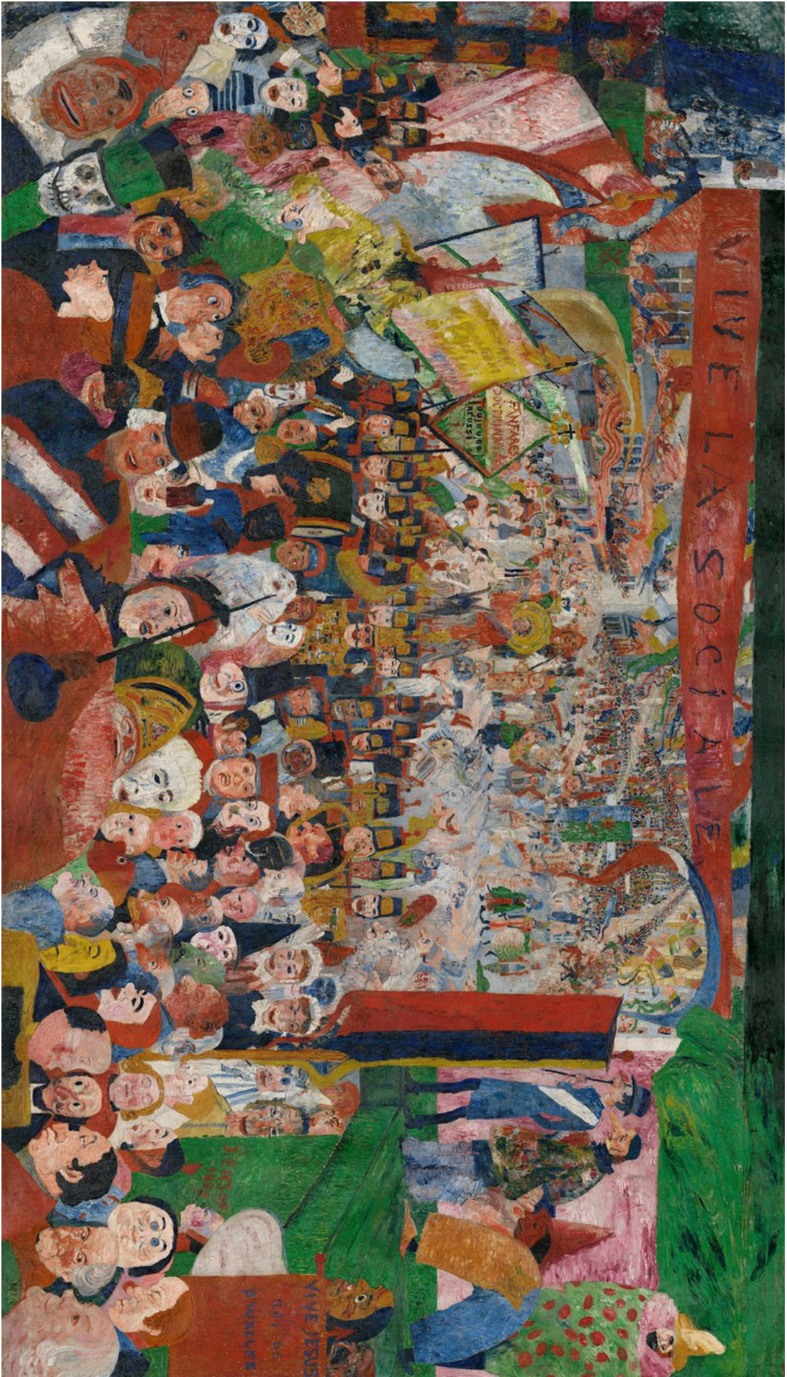
De intrede van Christus in Brussel in 1889, James Ensor, J. Paul Getty Museum Los Angeles