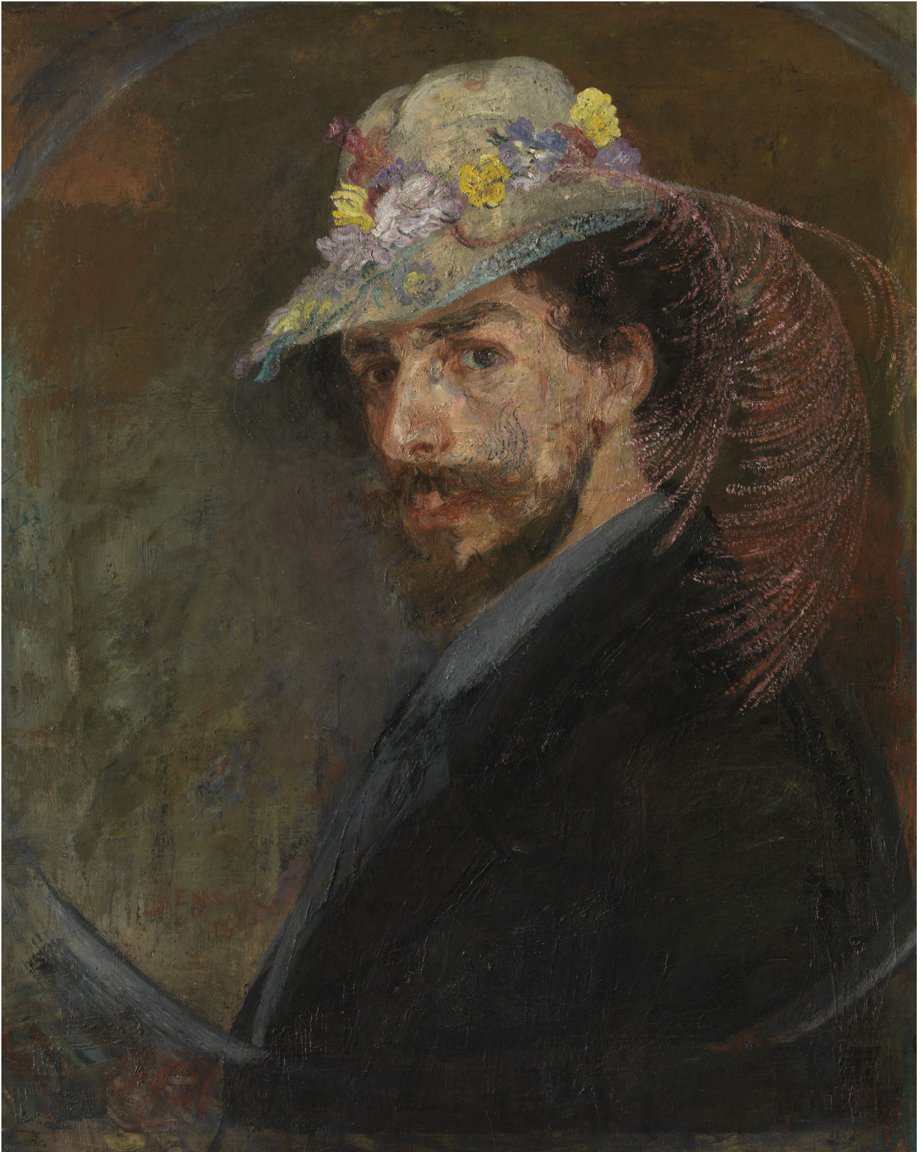
James Ensor, Stilleven met bloemenhoed , 1883, Mu.ZEE Oostende