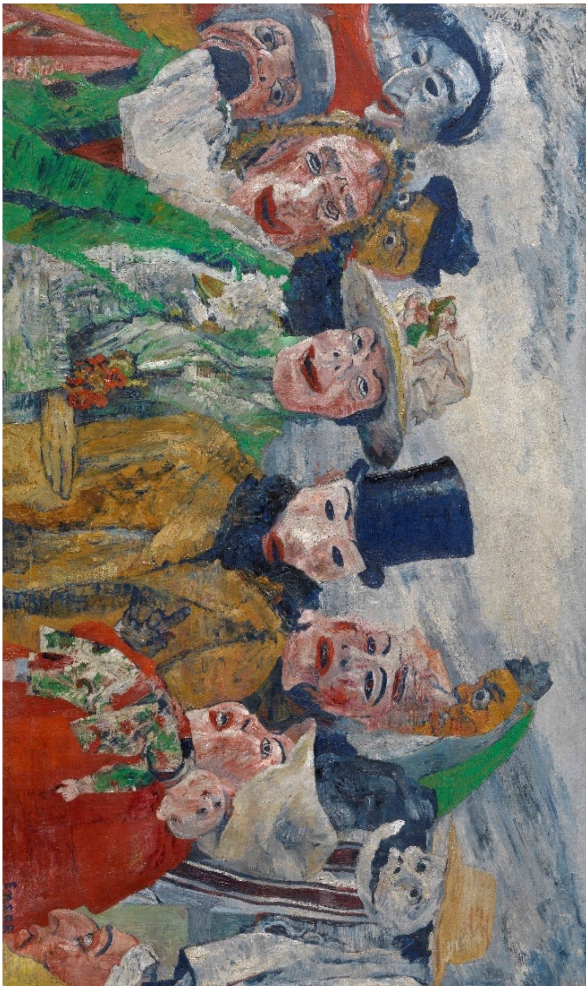
James Ensor, De intrige , 1890, KMSKA