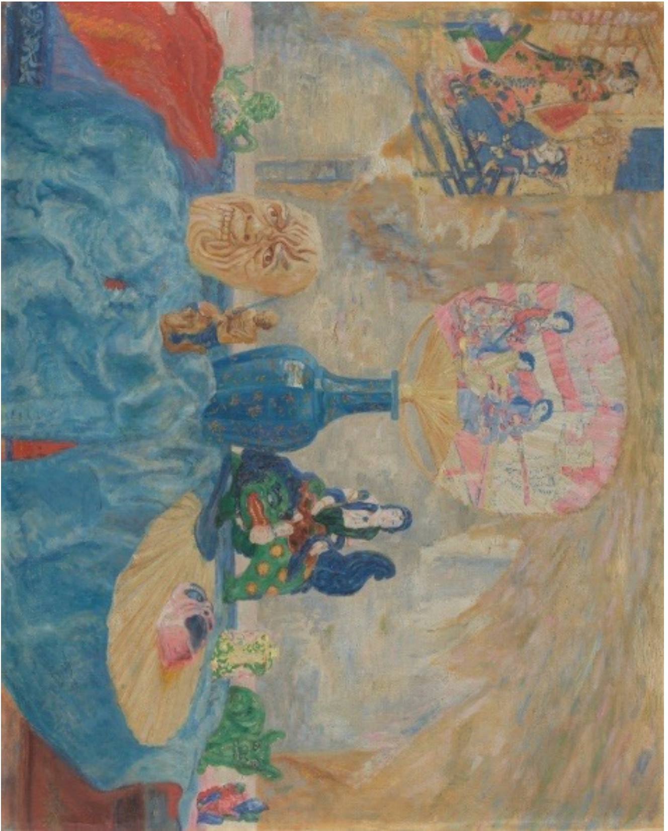
James Ensor, Stilleven met Chinoiserieën, 1906, KMSKA