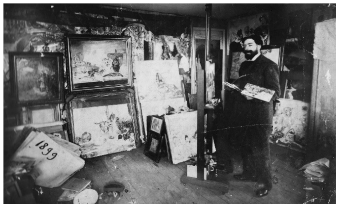
Anoniem, James Ensor in zijn atelier, 1900, Collectie Mu.ZEE bibliotheek Oostende - Stad Oostende

Ensor schilderde op een zolder van het huis waar hij eerst woonde. Toen hij verhuisde naar het statige herenhuis in de Vlaanderenstraat werkte hij meer in het salon. Daar ontving hij ook zijn bezoek: vrienden maar ook personen die geïnteresseerd waren in zijn schilderijen en prenten. Ensor schilderde veel en vlug. En alle schilderijen kwamen aan de muren te hangen. Maar hij had al snel plaats te kort. Gelukkig verkocht hij ook wat werk. Sommige schilderijen bleven lange tijd in zijn atelier liggen. Hierdoor kon hij composities nog herwerken. Want dat deed de kunstenaar vaak. Hij herwerkte of overschilderde meerdere schilderijen. Dat weten we uit onderzoek. Soms was er een volledige overschildering, soms was het maar gedeeltelijk en heel vaak voegde hij er nog details aan toe. Dat laatste deed Ensor om het schilderij wat op te frissen alvorens het te verkopen of tentoon te stellen.