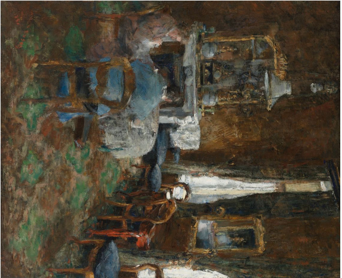
James Ensor, Burgersalon, 1881, KMSKA