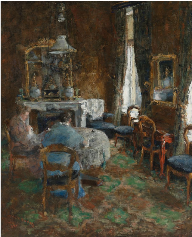
James Ensor, Burgersalon, 1881, KMSKA