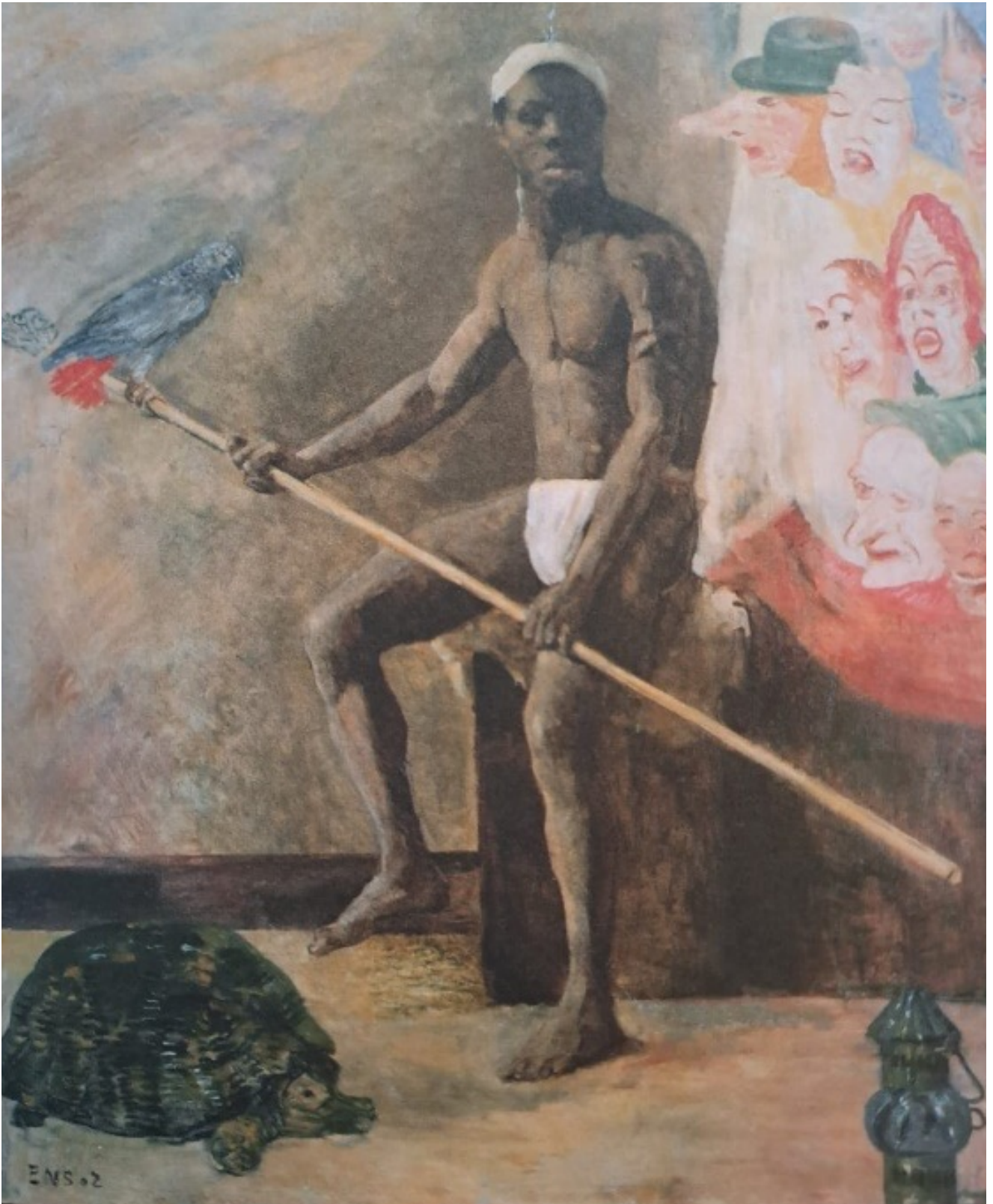
James Ensor, Maskers bekijken een zwarte goochelaar , ca. 1878-1879, Privé-verzameling.