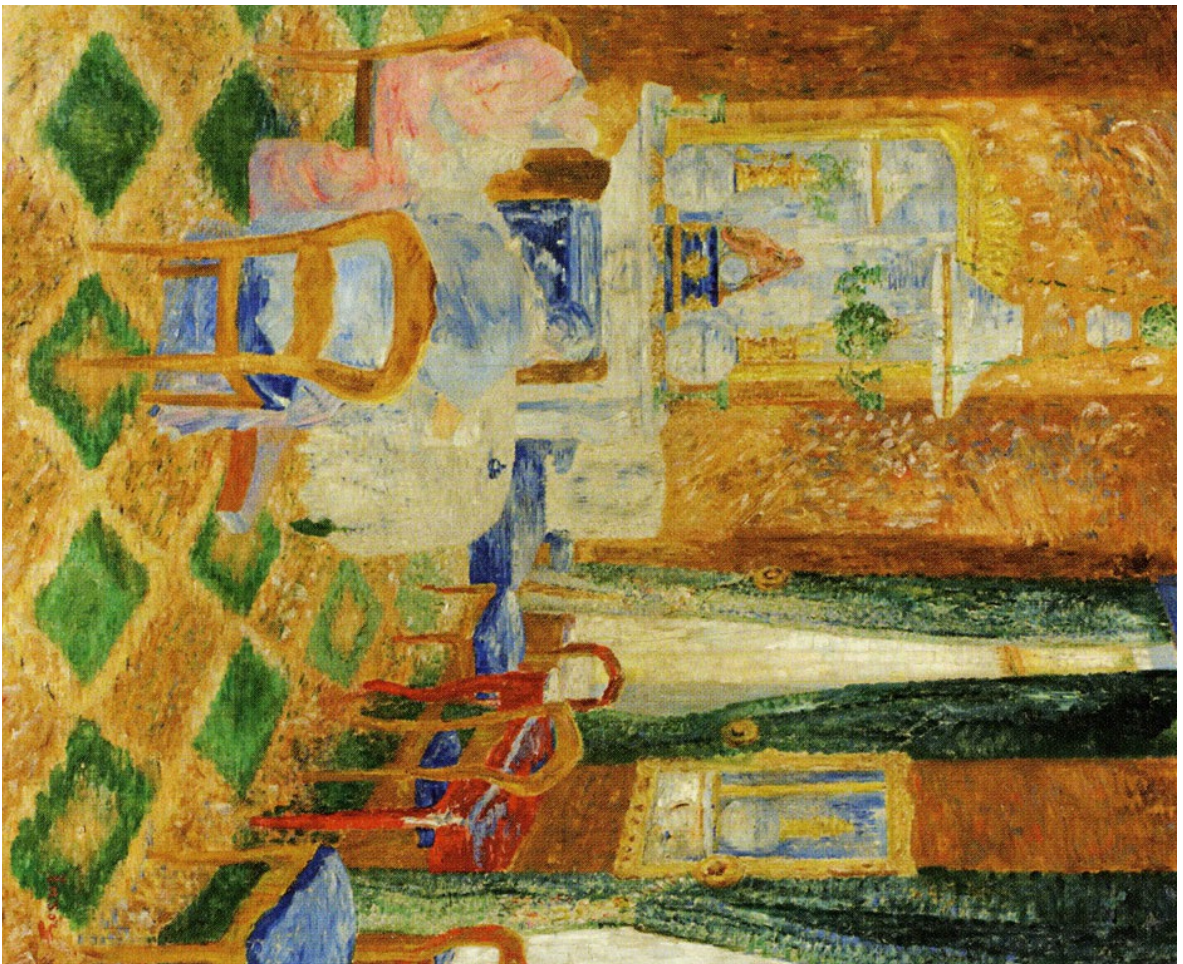
James Ensor, Burgersalon, 1911, Clemens-Sels-Museum, Neuss