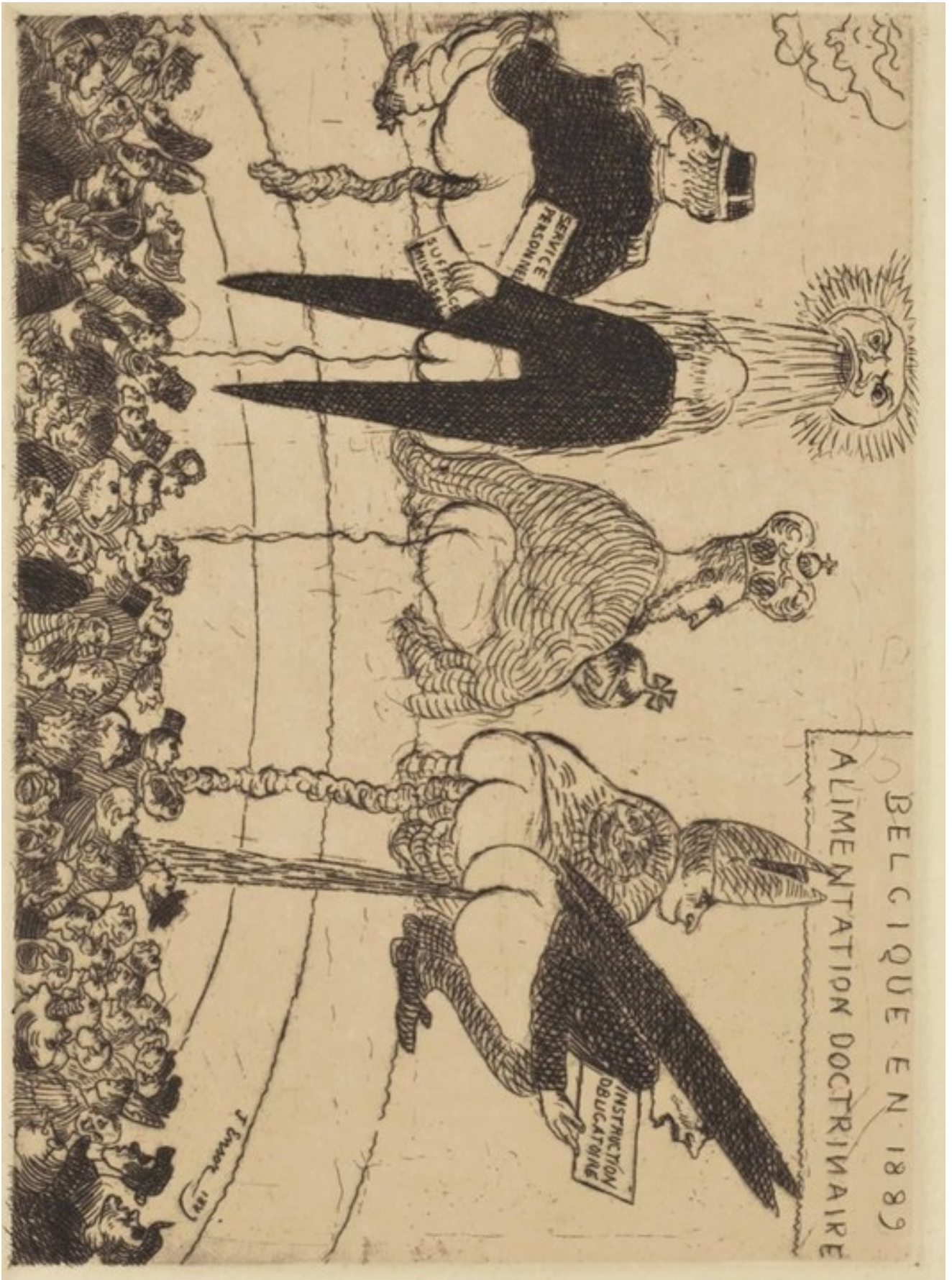
James Ensor, Alimentation Doctrinaire, 1889, Ensorstichting Oostende.